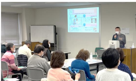
写真・動画による法人説明