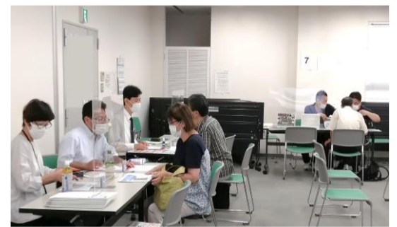
採用担当者との個別相談