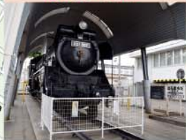
SLデゴイチ (D51 型蒸気機関車) は30年近い現役生活を終えた後、1972年から町田市に保存されています。