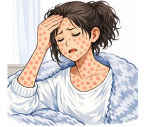
※イラストは文章生成AIにより作成