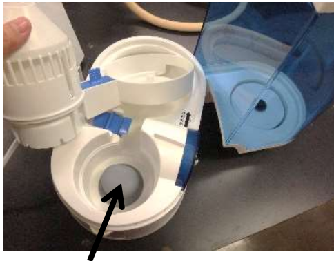
ヒーター部分に水あかが付きやすい