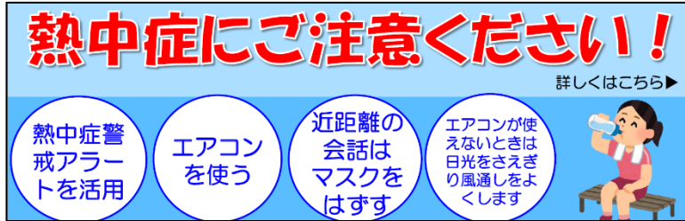
町田市ホームページのブランディングエリアへの掲載

周知活動：ポスター掲示、チラシ配布、LINE・メール配信、市ホームページ・庁舎施設案内モニターへの掲載、民間協定企業と協働したポスター・チラシの作成 等