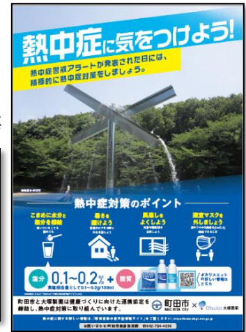
民間協定企業と協働して作成したチラシ