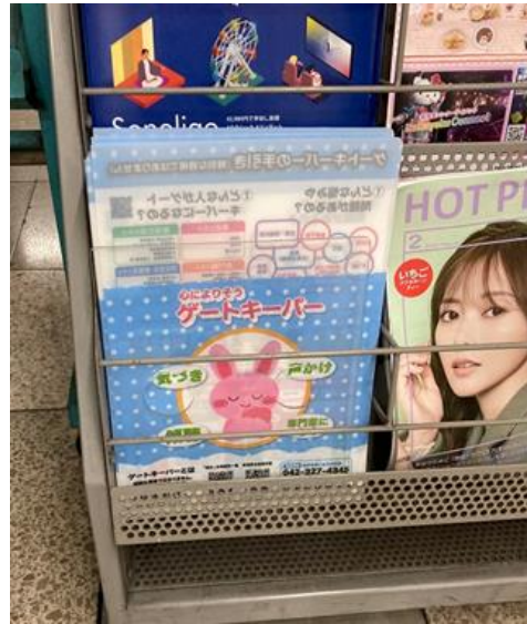
駅構内での普及啓発の様子