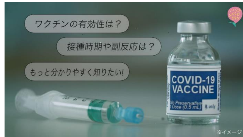
新型コロナウイルスとは！・ワクチンの効果は！