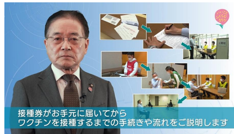
集団接種会場での接種の流れについて