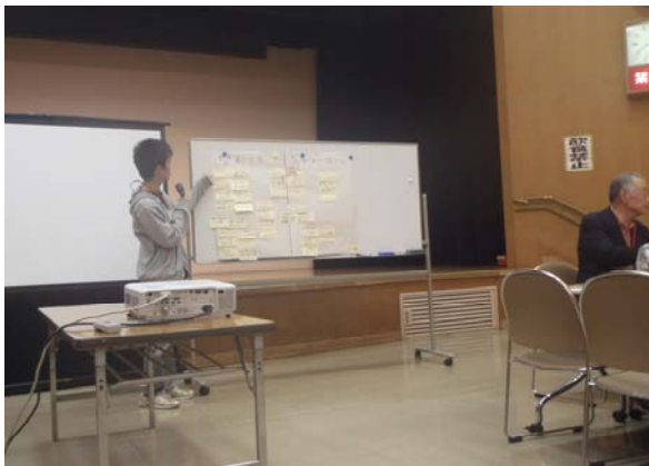
全体でのまとめの様子