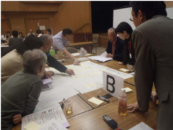
グループ会議の様子