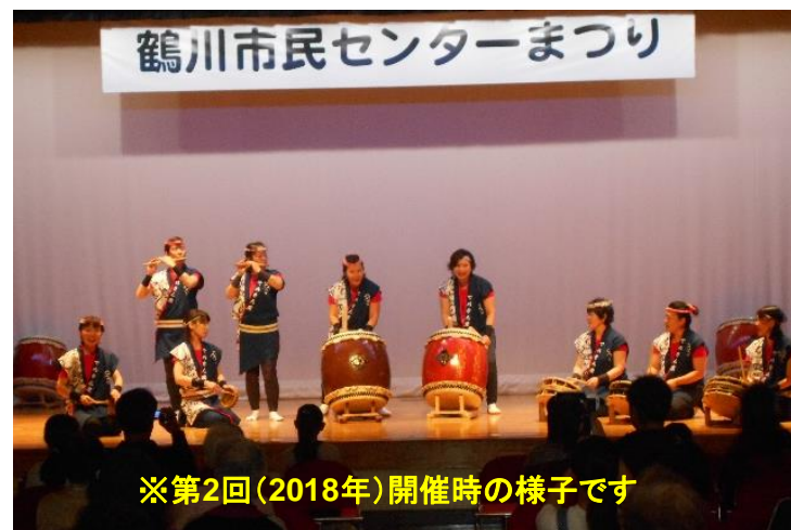
※第2回(2018年)開催時の様子です