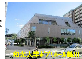
和光大学ポプリホール鶴川