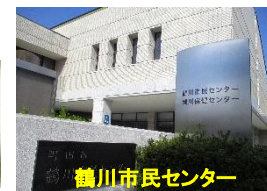
鶴川市民センター