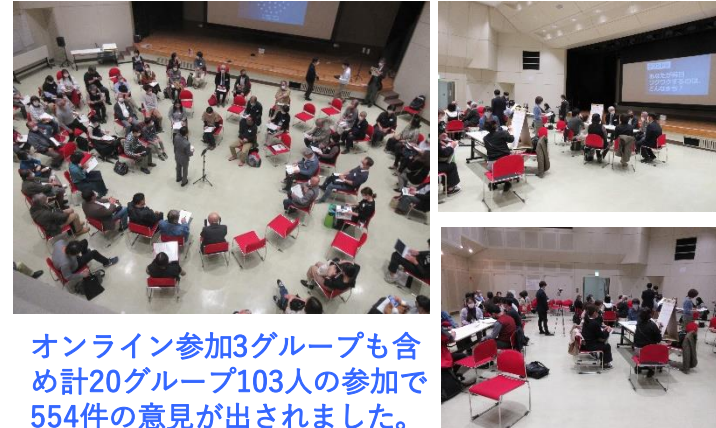
オンライン参加3グループも含め計20グループ103人の参加で554件の意見が出されました。