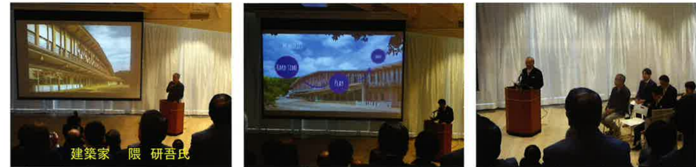
【お問合せ】 鶴川女子短期大学 町田市三輪町1135 ☎044-988-1128