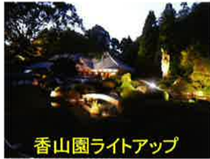
香山園ライトアップ