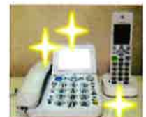
迷惑防止機能付電話機