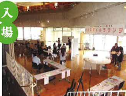
主催：鶴川地区協議会