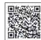
The Road 町田人

「The Road 町田人」のバックナンバーは以下の2次元バーコードからご覧いただけます。