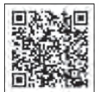
まちだをつなげる30人 -2022-

組織の垣根を超えて楽しみながら行うプロジェクト。その小さな1歩がやがて大きなうねりとなり、まちを創っていきます。詳しくは、町田市ホームページをご覧ください。