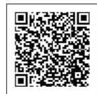
まちだをつなげる30人 -2020-

組織の垣根を超えて楽しみながら行うプロジェクト。その小さな1歩がやがて大きなうねりとなり、まちを創っていきます。詳しくは、町田市ホームページをご覧ください。