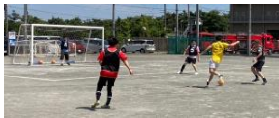
ソサイチ・フットサル教室の様子