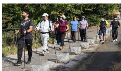
【スポーツ】 成瀬クリーンセンター テニスコート ノルディック ウォーキング教室 (31ページ)