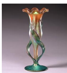
【文化・芸術】 町田市立博物館所蔵品展 ボヘミアン・グラス ザ・ベスト (9ページ)