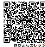
さがまちカレッジ