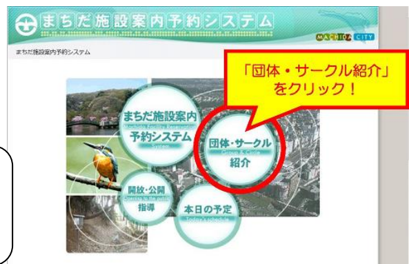
▲「まちだ施設案内予約システム」トップページ