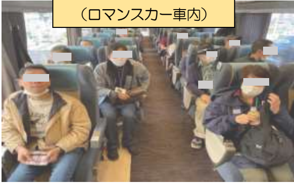
日帰り旅行の様子 (ロマンスカー車内)