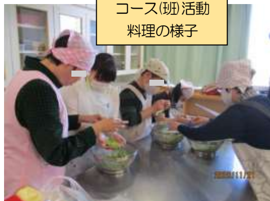
コース(班)活動 料理の様子