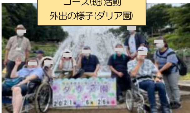
コース(班)活動 外出の様子(ダリア園)