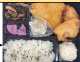
注文のお弁当（おかゆ・刻みなど特注も）

撮影当時はコロナ禍であったため、 感染症対策として、対面しないよう 机の向きなどに配慮している。