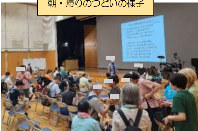
朝・帰りのつどいの様子