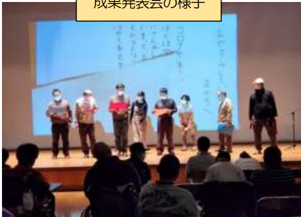
成果発表会の様子