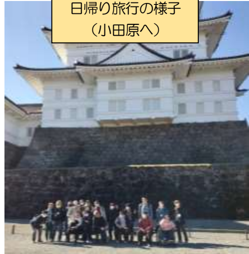
日帰り旅行の様子 (小田原へ)