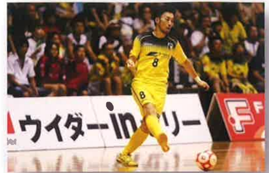
ASVパスカドーラ町田