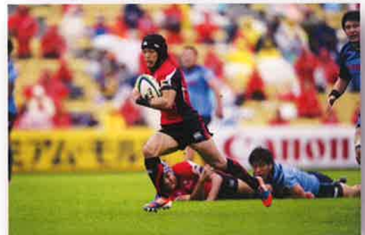
キャノンイーグルス