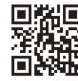
Jリーグ開催 情報はコチラ

イベントやグルメなど楽しいことが盛りだくさん！ 安心して過ごせるスタジアムでみんなを待ってるね！