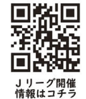
Jリーグ開催情報はコチラ

イベントやグルメなど楽しいことが盛りだくさん！ 安心して過ごせるスタジアムでみんなを待ってるね！