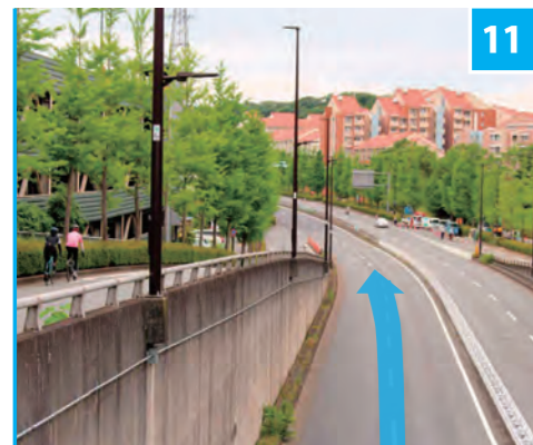
11 多摩ニュータウン通り 南大沢付近

景観が高度に整備された多摩ニュータウン。モミジバフウの並木が美しい上之根大通り（写真）を抜け、コースは豊ヶ丘小入口交差点を鋭角に左折。ダウンヒルの先の鋭角コーナーは、テクニックの見せどころでもある