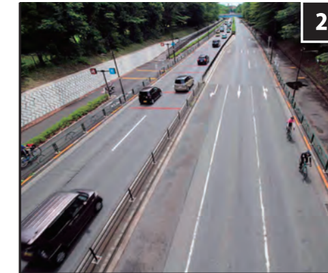
2 野川公園・東八道路

スタート会場となる武蔵野の森公園には本部施設のほか、多くの関係者用テントなどが立ち並び、スタートゲートも設置される。各国のチームカーもスタートを前にして集結、オリンピックレースのスタートにふさわしい雰囲気に