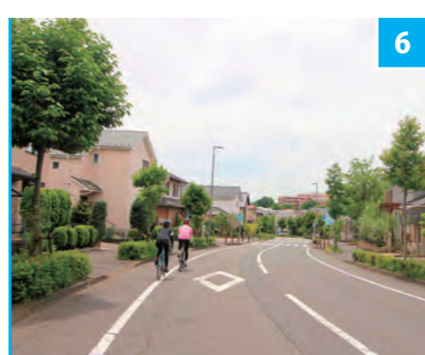
6 若葉台丘の手通り

大國魂（おおくにたま）大神を武蔵国の守り神として祀った社。この由緒ある神社の大鳥居をくぐりふだんは自転車走行が許されない参道を走るといって、外国人選手が感激すること間違いなしのシチュエーションが実現する