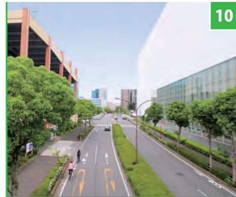
10 多摩中央公園通り バルテノン多摩付近

城山通りを抜け南多摩尾根幹線道路（通称・尾根幹）に入った選手たちは、いったん付近の住宅街を抜けてから再び尾根幹へ。美しい並木が続く上之根大通りから多摩中央公園通りを走り抜けて松が谷トンネルをくぐり、多摩ニュータウン通りで南大沢へ。小山内裏トンネルを経て、国道16号バイパスをくぐる坂下交差点の先で東京を抜け、神奈川県へと入っていく。武蔵野の森公園からここまでの距離は約37km、是政橋のオフィシャルスタートからは約27kmとなる。