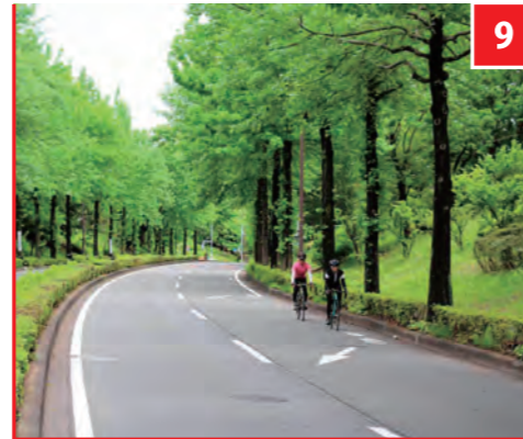
9 豊ヶ丘小入口交差点

多摩センター駅前から複合文化施設である「バルテノン多摩」や市民のオアシス「多摩中央公園」へと伸びるペDESTリアンデッキをくぐり、多摩ニュータウン通りへ。コースはさらに松が谷トンネルを抜けて、南大沢方面へ続く