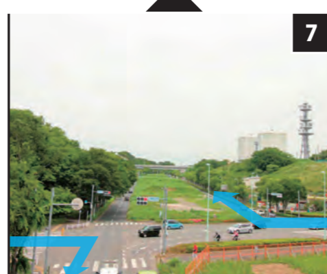
7 多摩東公園交差点

選手が2回通過する場所として注目されている交差点。写真右手側から尾根幹に入る集団は、交通規制された一方通行を逆走する形で右折。その後、聖ヶ丘・馬引沢エリアを抜け、今度は写真左側から手前方向へと右折して進む