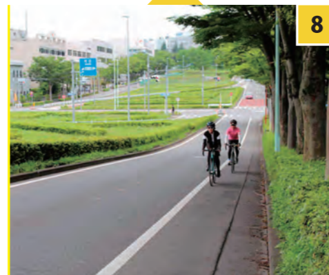
8 尾根幹・多摩東公園～ 南豊ヶ丘フィールド前

大規模ショッピングセンターがある南大沢は、多摩ニュータウンの一部として計画され、新しい住宅地のなかに自然が多く残されている。このあたりは交差点が立体交差になっている部分もあるが、レースはそのアンダーパス部分を通る