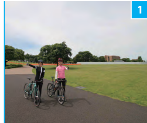
1 武蔵野の森公園 START

選手が2回通過する場所として注目されている交差点。写真右手側から尾根幹に入る集団は、交通規制された一方通行を逆走する形で右折。その後、聖ヶ丘・馬引沢エリアを抜け、今度は写真左側から手前方向へと右折して進む