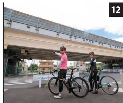
12 国道16号バイパス 坂下交差点

これを「ザ・尾根幹」という場所を選手が駆け抜ける。反対車線を逆走してきた選手たちは、途中で順行車線へ。このあたりの上りでアタックがかかってくる可能性も。集団は南豊ヶ丘フィールド前交差点から上之根大通りに入っていく