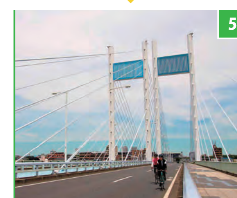
5 是政橋 OFFICIAL START

是政橋から稲城市に入り、いよいよ東京のサイクリストにはおなじみの「尾根幹」に出たと思いきや、コースは稲城の美しい住宅街へと迂回。若葉台エリアでは、電柱のない広い空の下を選手が駆け抜ける