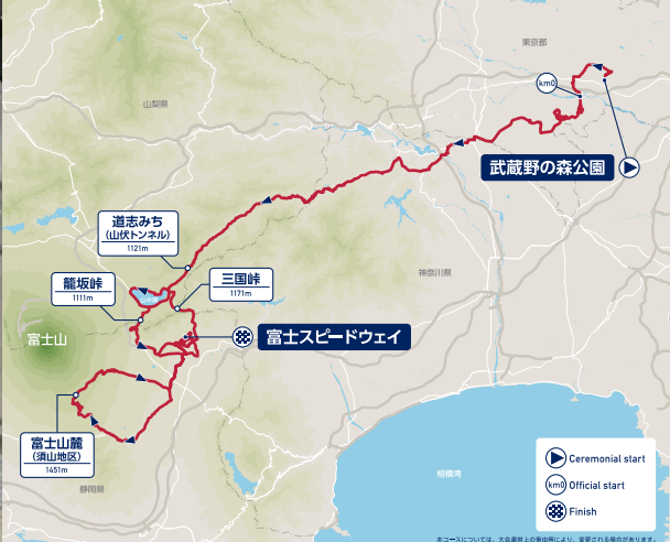
ロードレース(男子)コース