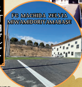
FC町田ゼルビア 三輪緑山ベース

鶴川香山園は、池泉回遊式庭園と書院造の建物を持つ、緑豊かな和の空間を楽しめる公園です。歴史を残しつつ新たに生まれ変わった鶴川香山園でのひと時をお楽しみください。