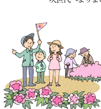
地域に精通したガイドから 歴史や自然の知識を学ぶ