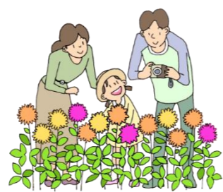
四季折々の草花を通して 四季の移ろいを感じる