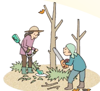
地域の方と協力しながら 次世代へよりよい環境をつなぐ