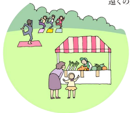
アクティビティや農産物の販売を通じ 地域の人と交流する