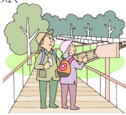
自然を身近に感じながら いろいろな施設を巡る