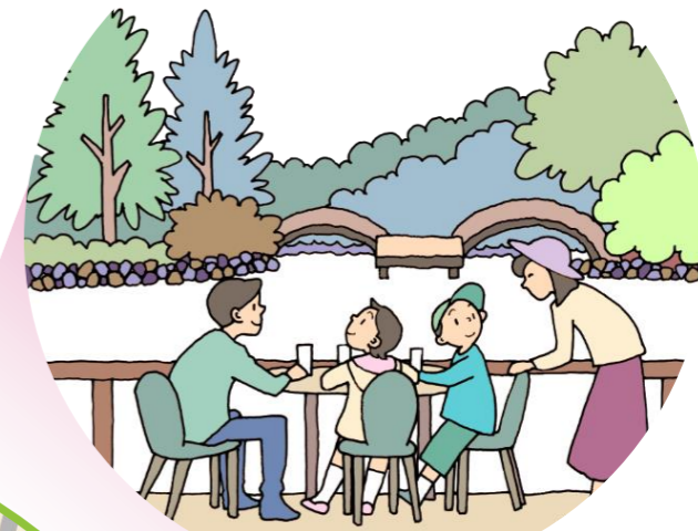
自然の中でご飯を食べながら ホッとするとほっと過ごす