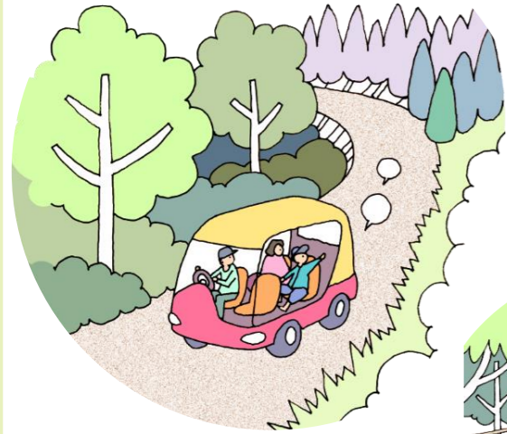
起伏のある地形が生み出す景色の変化を 楽しみながら移動する

四季彩の杜では、花、みどり、学び、体験、交流など、 様々なライフスタイルに合った時間を提供します。 これからの四季彩の杜のイメージをイラストに表しました。