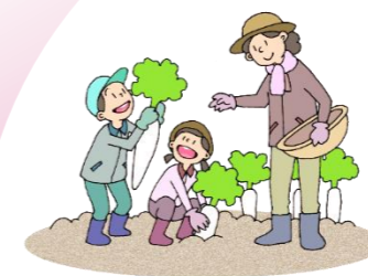
農体験を通じ 新鮮な農産物を収穫できる