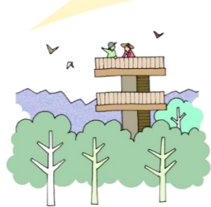
ハイキングの後に展望施設から 遠くの景色を見渡す