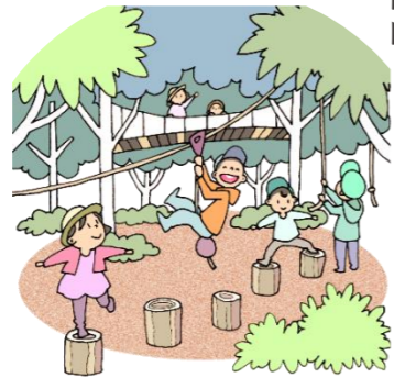
こどもたちが元気に遊べる フィールドがある