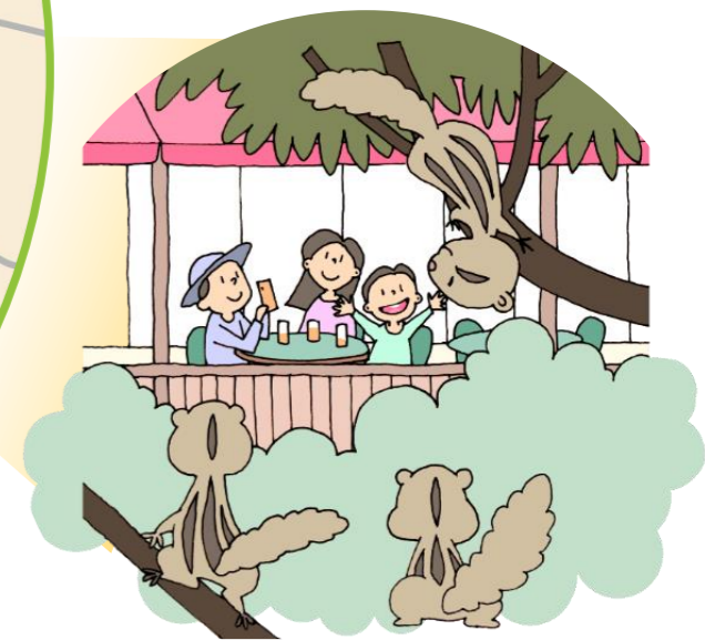
小動物とともに過ごすことにより 命の尊さや癒しを感じる