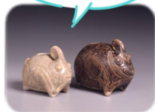
▲黒褐釉兔形壺 (こくかつゆううさぎがたつぼ)

12～13世紀のクメール王国で作られたウサギの陶磁器！ 噓んで楽しむ嗜好品(キンマ)を入れるよ！