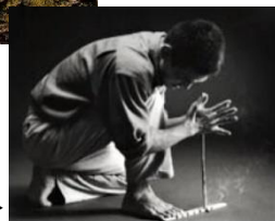
キリモミ式発火法▶