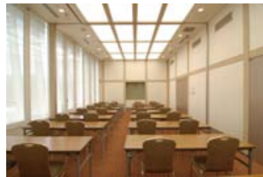
サルビア使用例／標準定員30名

利用形態に応じて分割して利用できる会議室（けやき、サルビア）があります。 また、各種テーブルコーディネートやケータリングサービスを利用してのご 宴会やパーティーについてもご相談を承ります。