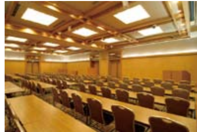
けやき使用例／標準定員120名