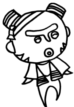
町田市縄文土器キャラクター まっくう