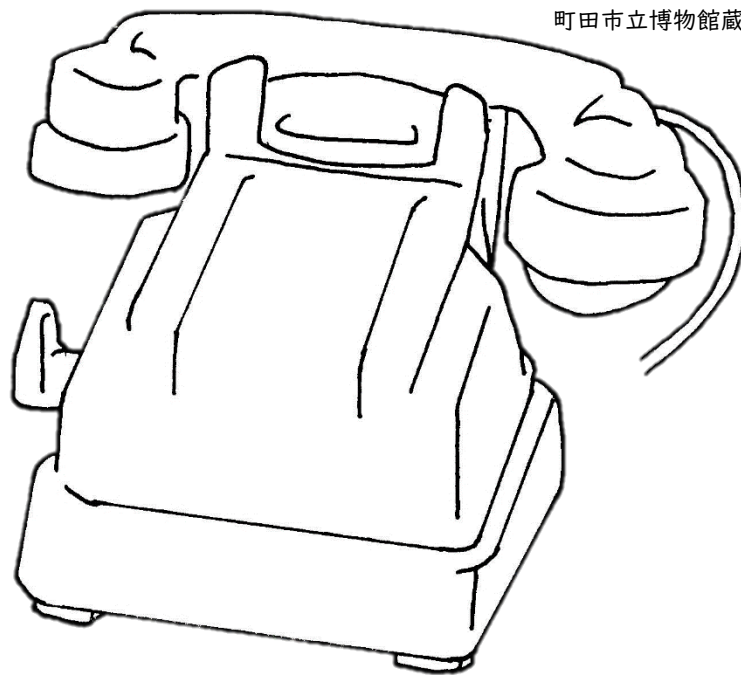
3号磁石式卓上電話機 町田市立博物館蔵