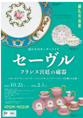
作品貸出5 妃たちのオーダーメイド セーヴル フランス宮廷の磁器