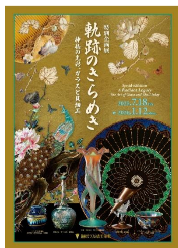
作品貸出4 軌跡のきらめき —神秘の光彩、ガラスと貝細工—