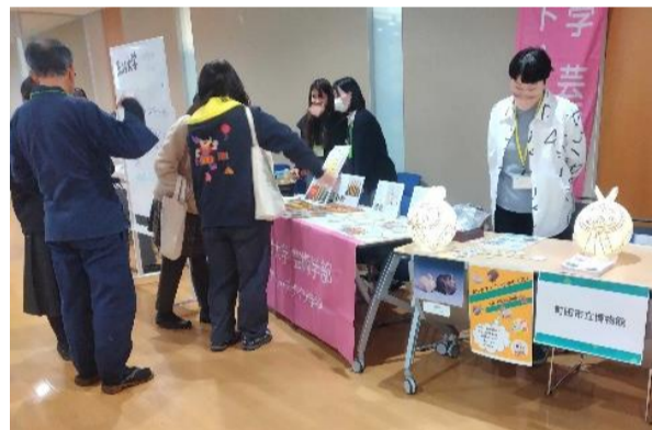
ブース出展11 まちカフェ!