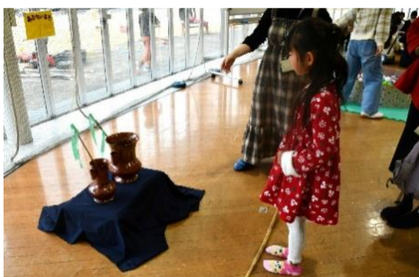
ブース出展12 こどもセンターつるっこ ホットフェス