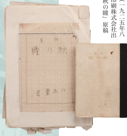
『秋の瞳』(一九二五年八月 富士印刷株式会社出版部)と『秋の瞳』原稿