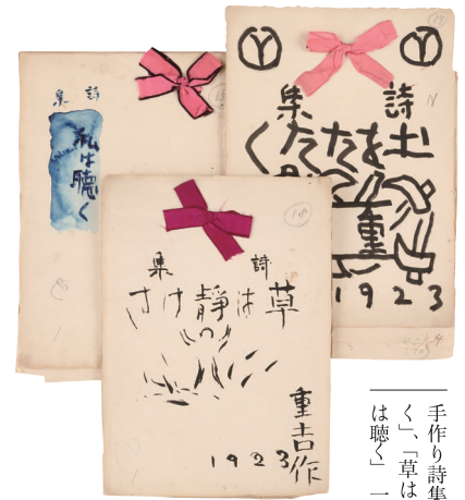
手作り詩集「土をたたは聴く」、「草は静けさ」、「私」は聴く」一九二三年

東京府南多摩郡堺村相原(現・町田市相原町)に生まれた詩人・八木重吉(1898-1927)は、29年の短い生涯の中でキリスト教への一途な信仰に貫かれた清澄で至純な詩を残しました。重吉27歳のときに、再従兄である小説家・加藤武雄の尽力により生前唯一となる詩集『秋の瞳』を刊行。プロレタリア文学やダダイズムなどの多様な文学が花開いた大正詩壇の中で新鮮さをもって迎えられ、高く評価されました。