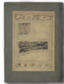
石川啄木 歌集『一握の砂』 (1910年 東雲堂書店)