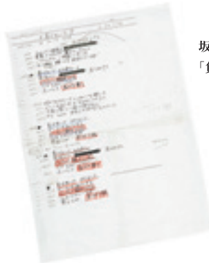
坂井泉水 直筆原稿 「負けないで」

本展では、代表曲を振り返りながら、坂井が愛唱した石川啄木の短歌や「詞」に込められた想いに注目し、直筆歌詞やレコーディング資料などを通して、詞が紡ぎだされるまでを紐ぎます。出口の見えない不安、孤独や閉塞感に包まれた今だからこそ、坂井泉水の「ことば」は私たちの心に語りかけ、新しい明日へとそっと背中を押してくれることでしょう。