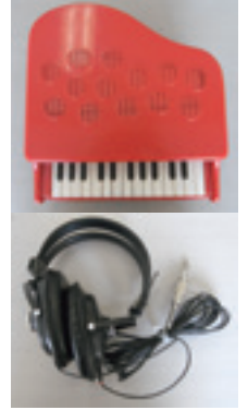
トイピアノと 愛用のヘッドフォン