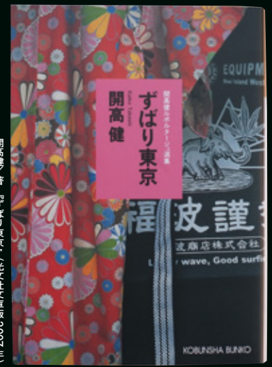
開高健著『ずばり東京』(光文社文庫版2007年)

半世紀の間に蓄積された「東京」の姿に共通項や普遍性を見出し、改めてこの都市が与える創造性の秘密に迫ります。