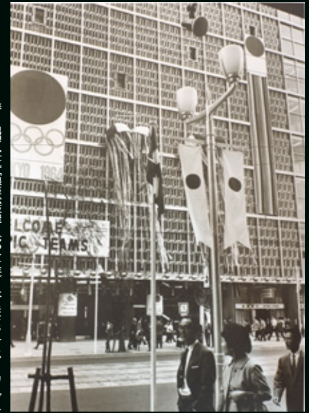
春日昌昭/写真「銀座松坂屋」(1964年) はこたてフォトアークナイス