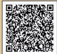
町田市ホームページ

町田市内には、見学できる遺跡や考古資料を展示している施設がたくさんあります。各遺跡・施設の詳細情報はホームページでご覧ください！