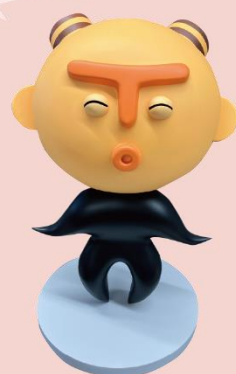
まちだ縄文キャラクター 「まっくう」