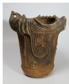
深鉢形土器 相原坂下遺跡