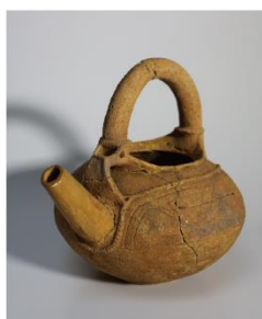
注口土器 なすな原遺跡