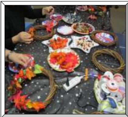
ママ友のサークルで♪