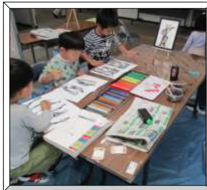
町内会のイベントで♪