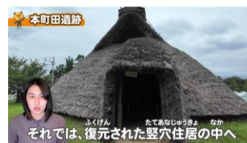
「縄文のまちだ～町田の遺跡を見てみよう～」