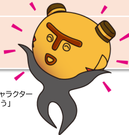
まちだ縄文キャラクター 「まっくう」