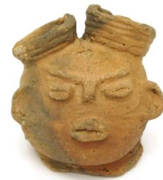
モデルになった中空土偶頭部