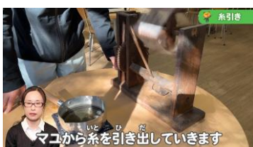
「町田と養蚕～おカイコさんのいたくらし～」