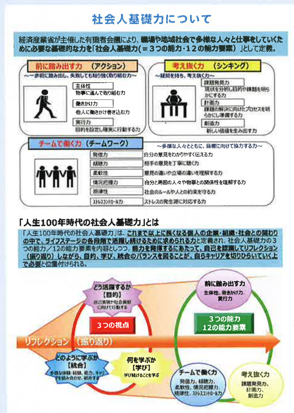
経済産業省ホームページ「人生100年時代の社会人基礎力」 ( https://www.meti.go.jp/policy/kisoryoku/ )