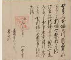
歴史資料：北条氏照朱印状