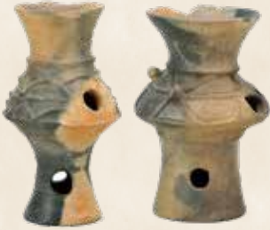
考古資料：異形台付土器