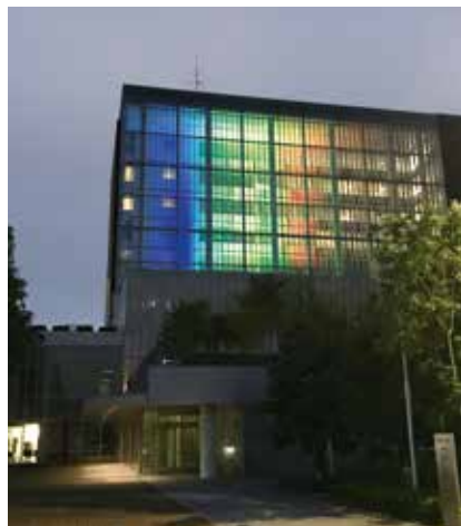
オリンピックカラー