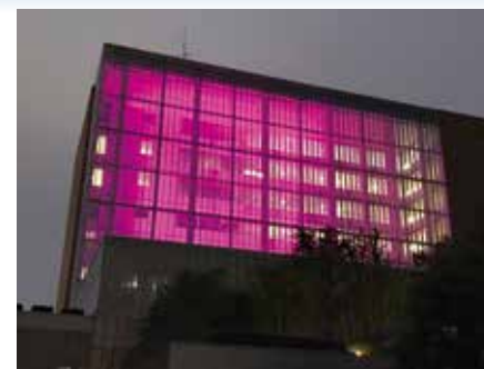
ピンクリボンカラー

市有財産活用課☎724・2165 また今後は、オリンピックカラーのほか、ピンクリボン運動などさまざまな啓発活動と連携し、活動にあったカラーでライトを点灯します。 なお、投光器は7台(フルカラーLED)で、ライトアップの電力使用量は年間約284.4kWhとなり、電気料金に換算すると年間約4800円です。 場市庁舎西側アトリウムガラス面