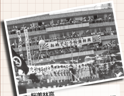
桜美林高 1976年・夏の大会で優勝し、旧市庁舎前で報告会を行いました

小野路球場の夜間照明設備の整備が完了し、リニューアル記念として、硬式野球「桜美林高等学校対 日本大学第三高等学校」の試合を市と町田市軟式野球連盟の共催で開催します。