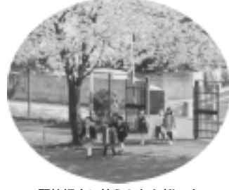
開校記念に植えられた桜の木