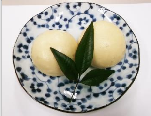
一口食べると酒麴の香りが広がる里山まんじゅう