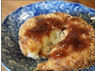
ボリューム満点でどこか懐かしい手づくりコロッケ