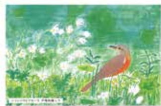
ニリンソウとアカハラ(水彩画)

能登半島の地震に見舞われた市町村の復旧、復興が急がれます。町田市は当該市町村との災害時救援協定を結んではいませんが、義援金の募金・援助について日本赤十字社を通じて行っています。市民の皆様のご支援・ご協力をお願いいたします。