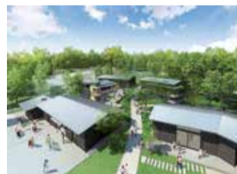
ウェルカムゲート内

いずれも、まちだ施設案内予約システムで利用申し込みができます。事前に利用者登録(団体登録)が必要です。