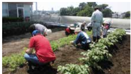
ボランティア作業の様子