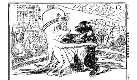
「幕内の相撲」(『团团珍聞』明治14年10月22日)