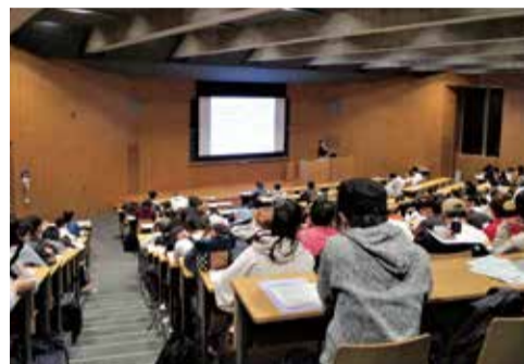
和光大学での出張講座の様子