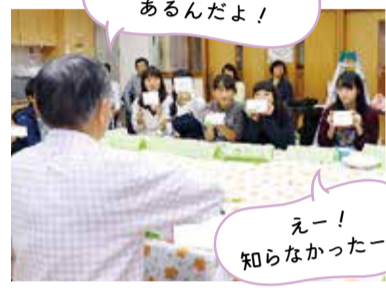
☎市民協働推進課 ☎724・4362

今年度4回目は、ばおで実施しました。和やかな雰囲気の中で、若者と石阪市長はゲームをしながら町田に関することを話し合いました。