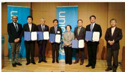
検証作業の委嘱状交付の様子

1989年に採択され、1990年に発効した「子どもの権利条約」を市町村レベルで具体化するプログラムの日本版で、子どもにやさしいまちづくりができているかを検証する作業です。町田市は、町田市市民参加型事業評価や子どもセンターを始めとする子どもの居場所づくり等が評価されたことがきっかけで、この検証作業に参加しています。