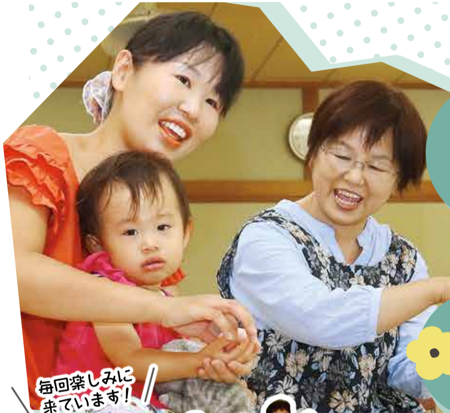
毎回楽しみに 来ています!