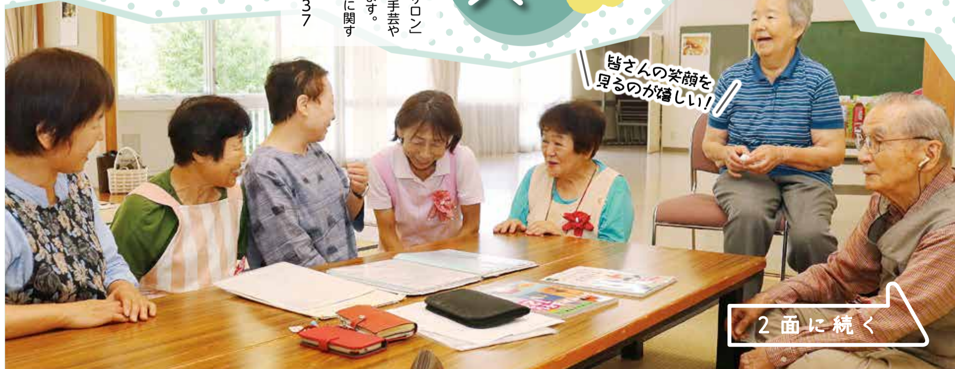
皆さんの笑顔を見るのが嬉しい!