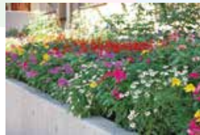
最優秀賞 ききょう保育園

※その他、優良賞に19団体、努力賞に28団体、本年度特別賞「ラグビー優秀賞」に5団体、「ラグビー賞」に16団体が選ばれました。※受賞団体等コンクールの詳細は、町田市ホームページでご覧いただけます。なお、審査会は9月19日に実施したため掲載写真と現在の開花状況は異なります。