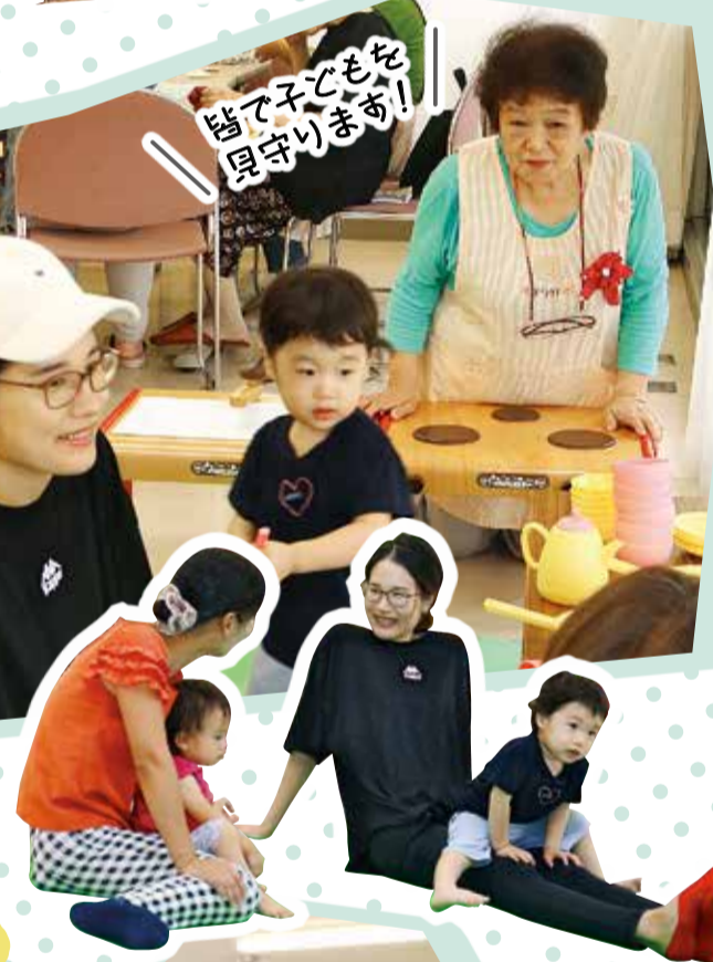
で子どもを 随分守ります!