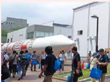
昨年の特別公開の様子

☎11月2日(土)午前10時～午後4時30分 場同キャンパス(相模原市中央区由野台3-1-1) 他