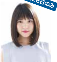
9月28日のみ 女優 川島 海荷さん

※トラブルやゲストの都合により予告無くイベント内容が変更または中止となる場合があります。あらかじめご了承ください。