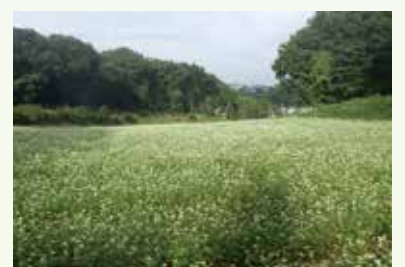
白い花が一面に広がるそば畑

今号の広報紙は、12万811部作成し、1部あたりの単価は25円となります(職員人件費を含みます。また作成経費に広告収入等の歳入を充当しています)。