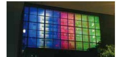
市庁舎ライトアップの様子(ナミビアカラー)