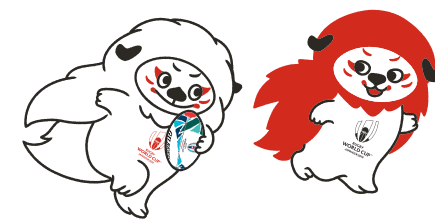
大会公式マスコット レンジー

点灯時間 | 午後7時~午後9時(9月)、午後6時30分~午後9時(10月~11月)