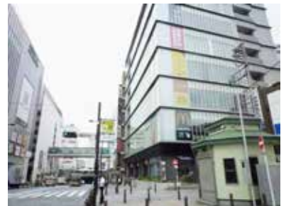
民間交番の横のビルに新たに入居した「コワーキングオフィス」

近年、働き方も変わってきています。在宅勤務も増えてきました。身近にサテライトオフィスを、というニーズも高まっています。そうした時代が求めるものに答える、それをこの町田で答えを出す、そんな意気込みの感じられるチャレンジだと思えます。この3月に策定した「町田市産業振興計画19-28」のキャッチフレーズは「チャレンジするならTOKYOの町田から!」です。町田市内の起業・創業、事業拡大に期待したいと思います。※コワーキングオフィスとは、複数の事業者の利用に供するための事務所・打ち合わせスペースの機能を有するオフィスです。