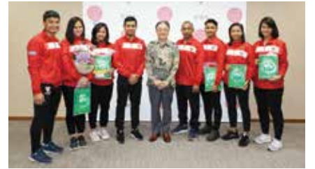
8月27日にはコーチと共に市役所を訪れました