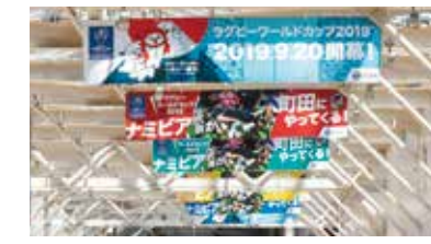
ペDESTリアンデッキ装飾の様子

ラグビーワールドカップ2019™日本大会が9月20日(金)に開幕します。大会を盛り上げるため、市内各所でラグビー装飾を行っています。大会期間中は、市庁舎のライトアップも実施します。