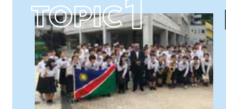
ナミビア大使館と 鶴川中学校の交流